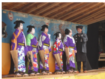
次の時代を担う役者たち