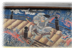
明治 31 年 奉納された幕