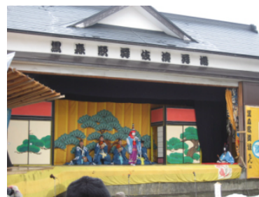
伏見神社社殿に常設歌舞伎場