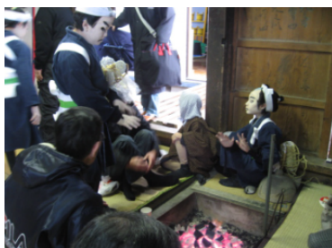
出番を待つ子ども役者