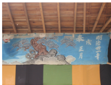
明治 31 年奉納された幕