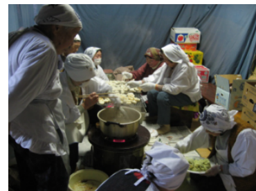
舞台裏では餅を焼いて役者やスタッフの食事づくり。