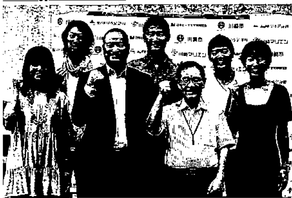
「JBVツアー2010ビーチバレー川崎市長杯」をPRする選手たちと阿部孝夫市長（前列の右から2人目）

第7戦は10月7〜10 日。チケットは前売り でS席4500円、A 席2250円で今月7 日から販売を開始す る。問い合わせは同ツ アー事務局（03・35 52・1078）へ。