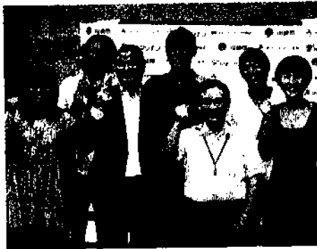
阿部市長（前列右から2人目）を囲んでカツホーズする出場選手ら

会見には選手5人が出席。日本ランキング1位の朝日選手は「2層の大男が砂の上でどれだけジャンプするのか見てほしい」とPR、浦田選手は「ナイターになれば、白い砂でプレーする選手が1層映える」と見ど