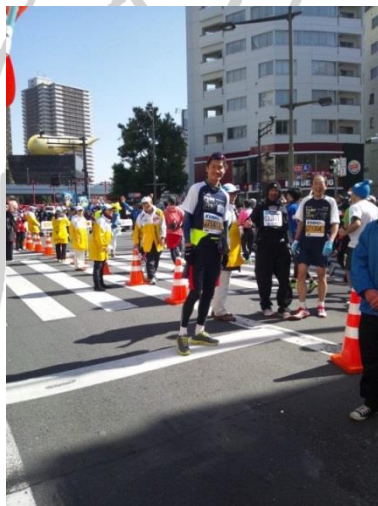
昨年の応援し隊の様子。ひときわ目を引く応援で朝日を激励しました。