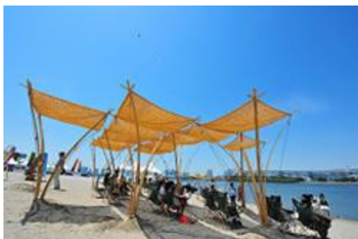
「竹のパーゴラ」海辺の図書館