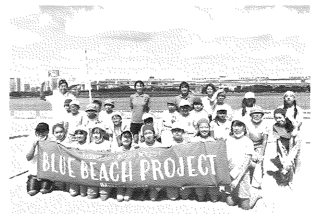
生徒とビーチにて記念撮影

おだいばビーチは、イベントやスポーツの場というだけでなく、教育の場としても利用できる資源であると実感し、海辺を利用した新しい学校教育の取り組みを検討しながら、今後も継続した事業となるよう、学校と地域と連携を図っていく。