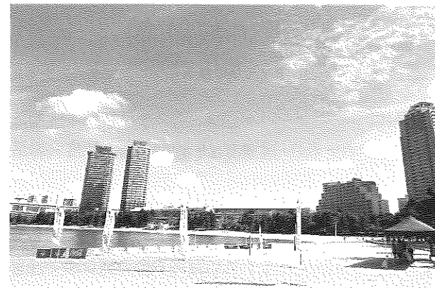
お台場海浜公園おだいばビーチ（東京都港区）

東京都港区のお台場海浜公園内には、全長800mの人工ビーチが広がり、砂浜には伊豆諸島 神津島の砂がしきつめられている。おだいばビーチは、一年を通して様々なイベントが開催され国内外の観光客で賑わいを見せ、ビーチ・マリンスポーツのメッカとして愛好者や地元の方に親しまれているビーチである。2021年には「東京2020オリンピック・パラリンピック競技大会 トライアスロン会場」として使用され、また、お台場海浜公園からほど近いところにある潮風公園には「ビーチバレーボール会場」が設けられ、お台場から世界中に興奮と感動を与えた。