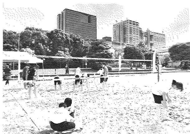
授業開始前に全員でビーチクリーン

はだしで砂に慣れることからスタートした。9月中旬ではあったが、日中は30℃近くまで気温が上がり、日差しも強く砂も熱くなっていたことから、熱中症や足裏の火傷がないよう、休憩や水分補給を多く取り、砂浜に定期的に水を撒きながら生徒たちの体調面に気を配った。過酷な中での授業ではあったが、子どもたちは弱音を吐くことなく、むしろ初めてのビーチでの体育授業を思い切り楽しんでいった様子であり、意欲的に取り組んでいた姿が印象的だった。授業を終え、次回の課題について講師、スタッフを交えて意見を出し合い、またボランティアの地域コーディネーターの方々からも意見をいただき、学校側と共有し、万全を図った。